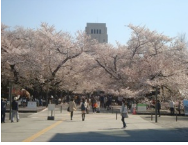
Tokyo Institute of Technology