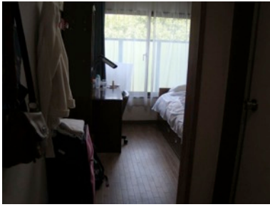
Dormitorio en residencia Komaba