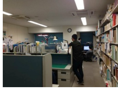
Laboratorio / Sala Estudiantes