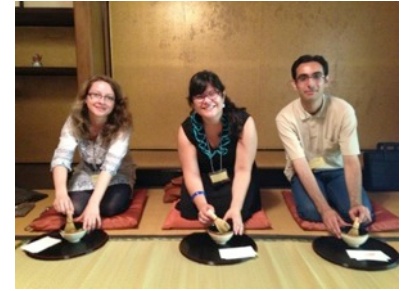
Ceremonia de Té

Desde hace un par de semanas me cambié a otro dormitorio, que queda en Aomi, Koto-ku, pues mi esposo llegó a vivir conmigo y el anterior dormitorio era sólo para solteros. Por supuesto que si tienes familia esto marca una diferencia, al menos lo fue para mí, ahora me siento mucho más en casa.