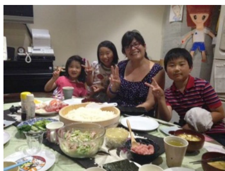
Visitando a mi familia Japonesa