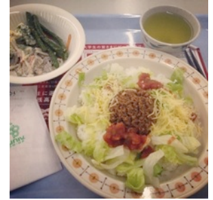
Almuerzo en el casino