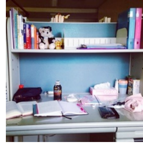
Escritorio en laboratorio