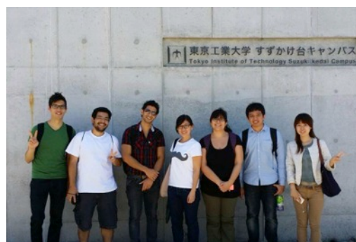
Visitando el Campus Suzukakedai