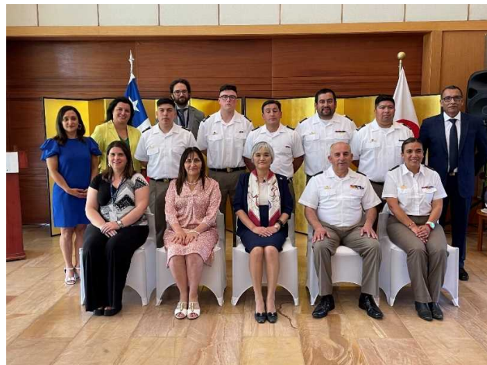
Foto conmemorativa con asistentes de las organizaciones beneficiarias