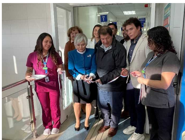
草の根・人間の安全保障無償資金協力「トゥカペル市診療所マンモグラフィー整備計画」引渡式出席