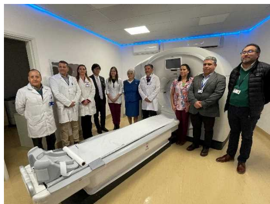
無償資金協力(保健・医療関連機材供与) タルカワノ市ラス・イゲラス病院引渡式(X線撮影装置及びCT)出席