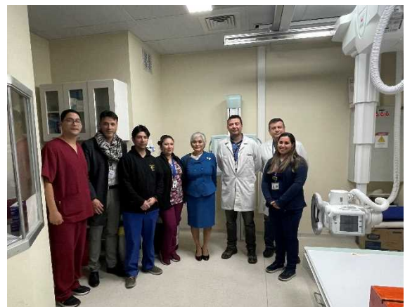
無償資金協力(保健・医療関連機材供与) コンセプション市地方病院引渡式(X線撮影装置)出席