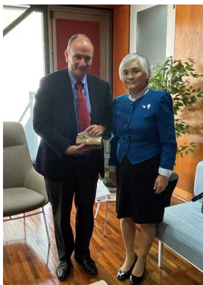
ビオビオ州ディアス知事表敬訪問

また、トゥカペル市においては草の根・人間の安全保障無償資金協力で供与されたマンモグラフィーの引渡式に、及び同州の3病院（コロネル市、コンセプション市及びタルカウノ市）において無償資金協力で供与された医療機材（X線撮影装置及びCTスキャナ）の引渡式に出席しました。これらの機材が、同州の医療体制及び住民の医療アクセスの向上に繋がり、住民の健康と生命を守ることに貢献することを期待しています。