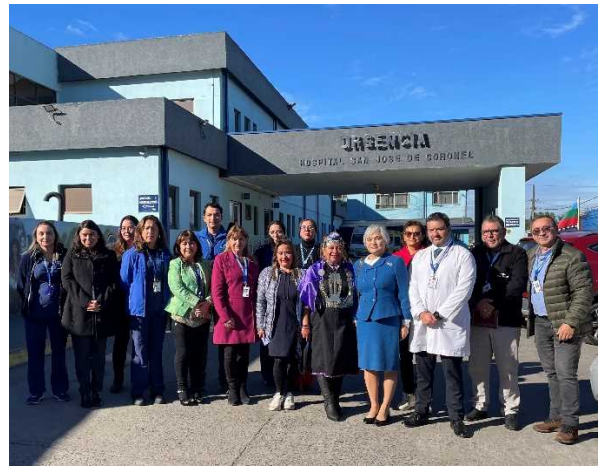
無償資金協力(保健・医療関連機材供与) コロネル市サン・ホセ病院引渡式(X線撮影装置)出席