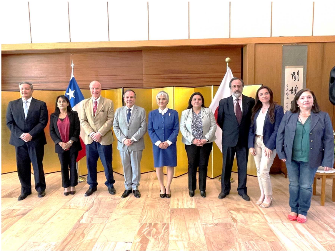
出席者全員での記念写真