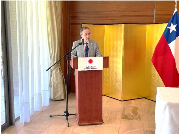
カルロス・コンデル提督財団レイバ理事長挨拶