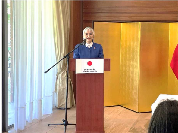
Discurso de la Embajadora