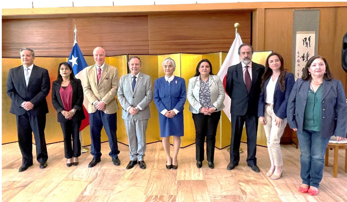
Foto conmemorativa con asistentes