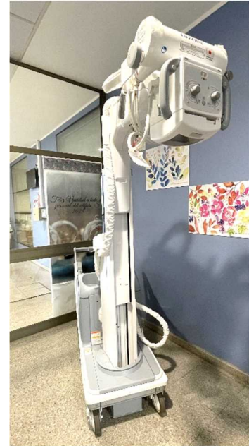
プエルト・モン病院無償資金協力（保健・医療関連機材供与）移動式X線撮影装置及び 草の根無償「プエルト・モン病院人工頭蓋骨技工室建設・整備計画」引渡式出席