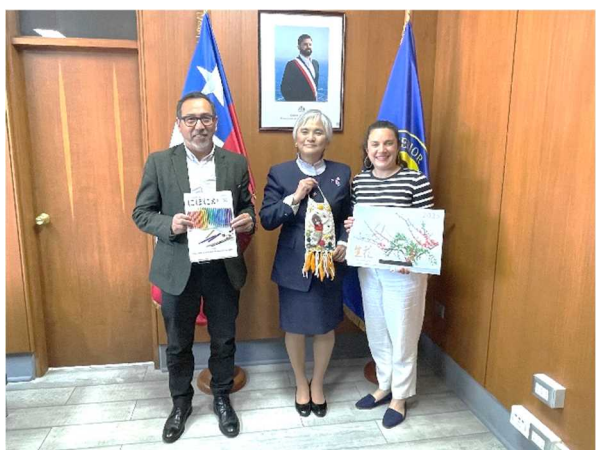
ムニョス州長官及びカルデナス経済・振興・観光省州代表表敬訪問