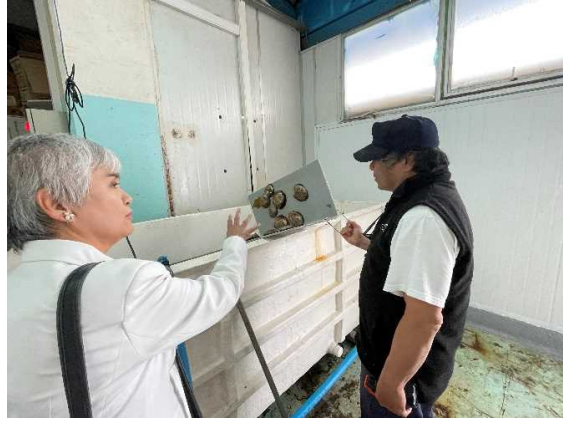
チンキウエ財団訪問