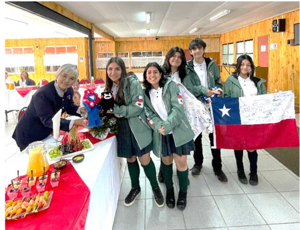
サン・クリストバル高校訪問