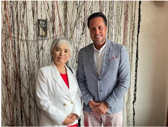
ウェインライト・プエルト・モン市長表敬訪問