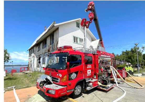
草の根無償「カルブコ消防団携行式ポンプ付中古救助工作車整備計画」引渡式出席