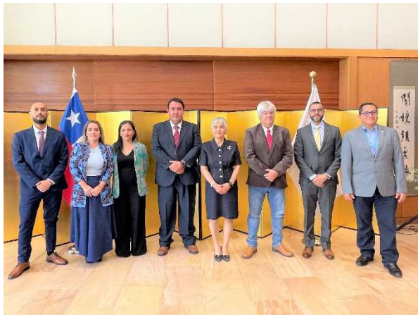
Delegación del proyecto de Arica