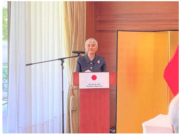
Discurso de la Embajadora