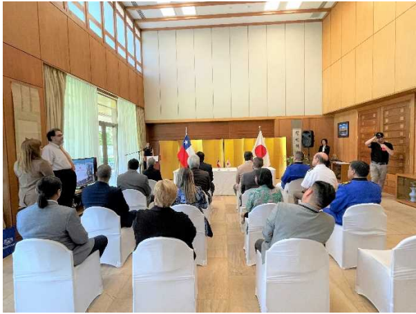
Ceremonia de Firma