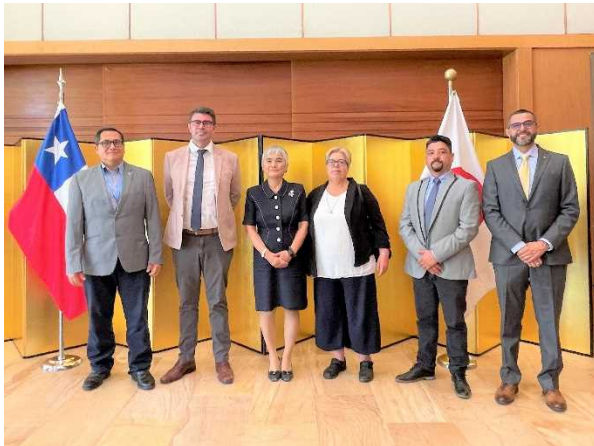
Delegación del proyecto de Yerbas Buenas