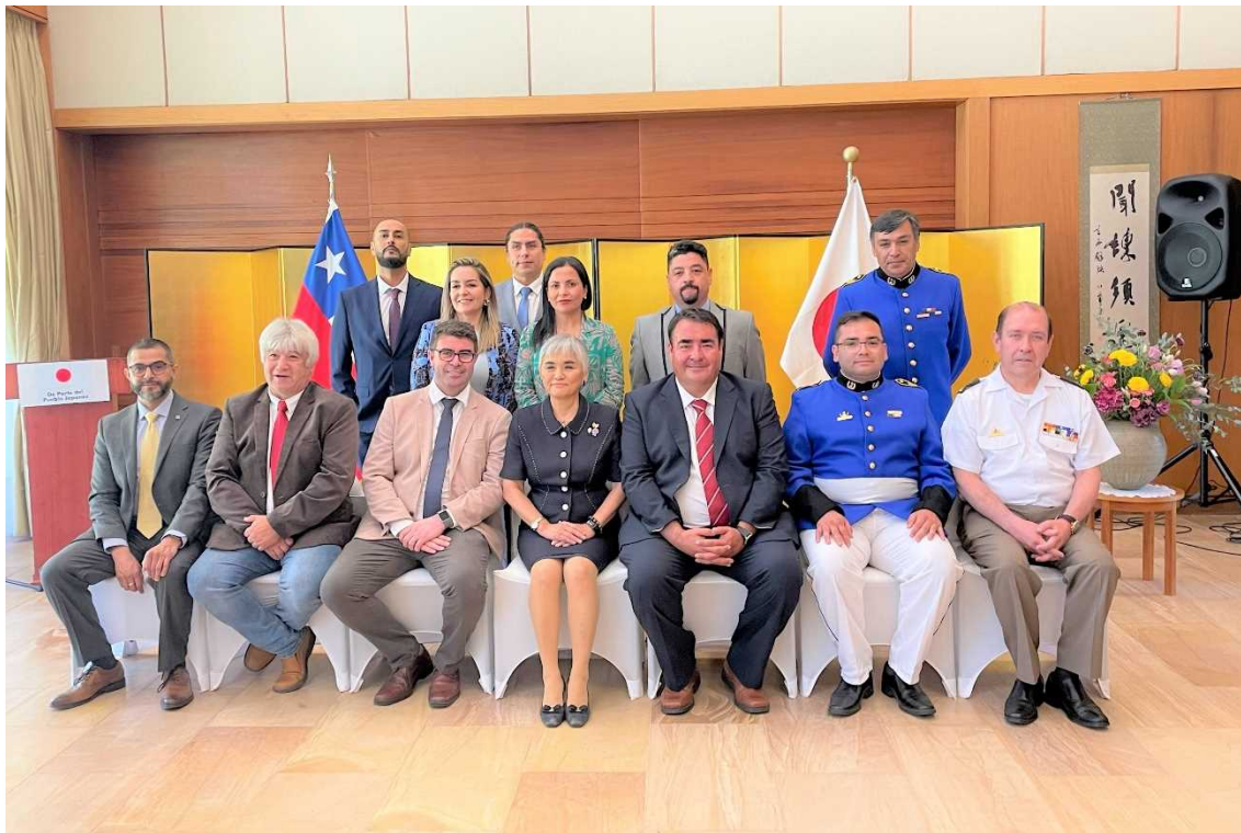
Foto conmemorativa con asistentes de las organizaciones beneficiarias e invitados especiales