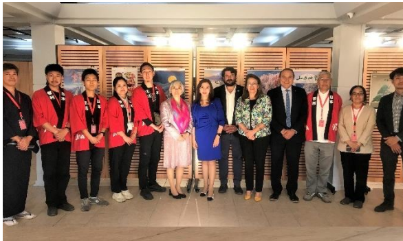
Embajadora ITO, Rectora Rojas, autoridades de la Universidad y voluntarios de JICA

En esa oportunidad, la Embajadora pudo saludar al público asistente y manifestar su cariño por la región y la importancia que tiene el intercambio cultural para las relaciones bilaterales entre nuestros países, destacando el generoso aporte de las empresas japonesas, que hicieron posible el alto nivel de producción de las actividades.