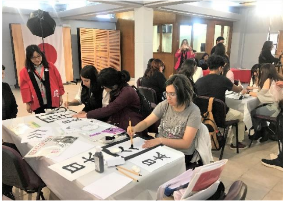
Taller de caligrafía dirigido por voluntarios de JICA