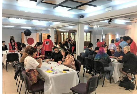
Taller de origami

Agradecemos a la Universidad de La Serena, a JICA, a las empresas japonesas y a todas las instituciones y personas que trabajaron arduamente para hacer posible este evento. Esperamos que a través del estrecho vínculo que existe entre la universidad y Japón, se pueda profundizar el entendimiento entre nuestros países.