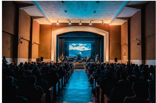
Concierto "Paisajes de Joe Hisaishi"