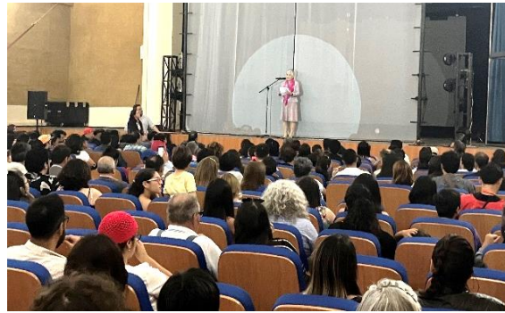
La Embajadora ITO saludó a los serenenses en el Aula Magna