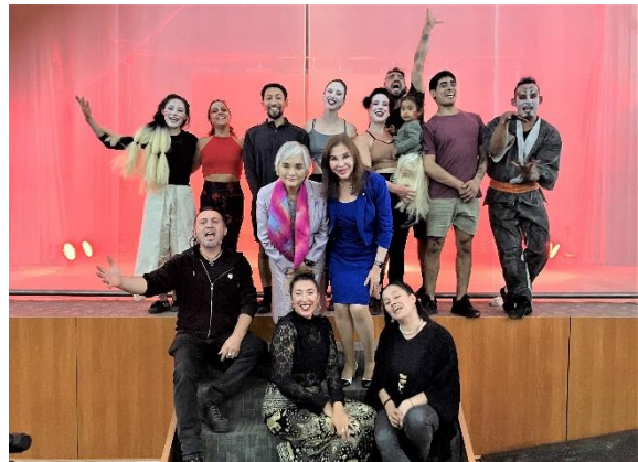
Embajadora, Rectora y Compañía La Cuarta Estación

Al día siguiente, pudo visitar los talleres culturales que dirigieron diversos voluntarios de JICA, sobre origami, caligrafía japonesa y juegos tradicionales japoneses, que se sumaron a charlas, demostración de kendo, bailes tradicionales de Japón, exposición de calendarios japoneses y fotografías, entre muchas actividades.