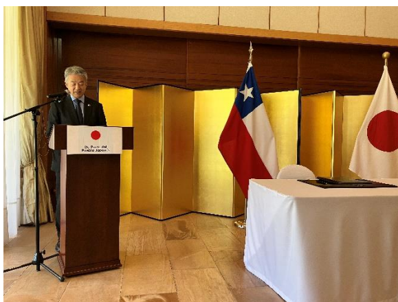
Palabras del Embajador SONE

En concreto, las iniciativas de esta oportunidad corresponden a la donación de un ecógrafo para la ciudad de Santa María y de una ambulancia para la ciudad de Rancagua. Esperamos que estos proyectos no solo puedan implementarse sin contratiempos, sino que también comiencen a dar frutos prontamente y que, a través de esta cooperación, la relación de amistad que existe entre Japón y Chile se profundice aún más.