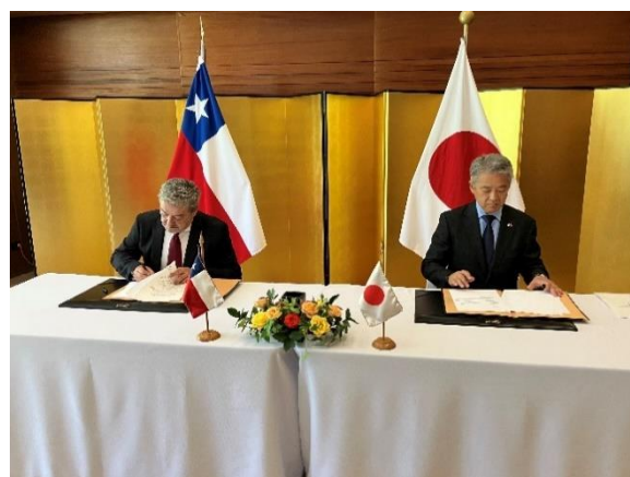
Firma de contrato (Ciudad de Rancagua)