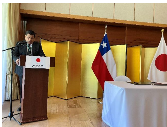
Palabras del Alcalde de Santa María