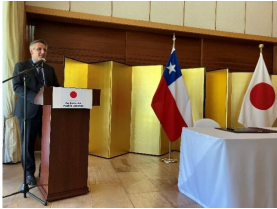
Palabras del Alcalde de Rancagua