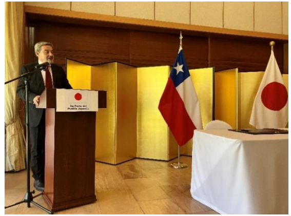
Palabras del Secretario General de la Corporación Municipal de Rancagua